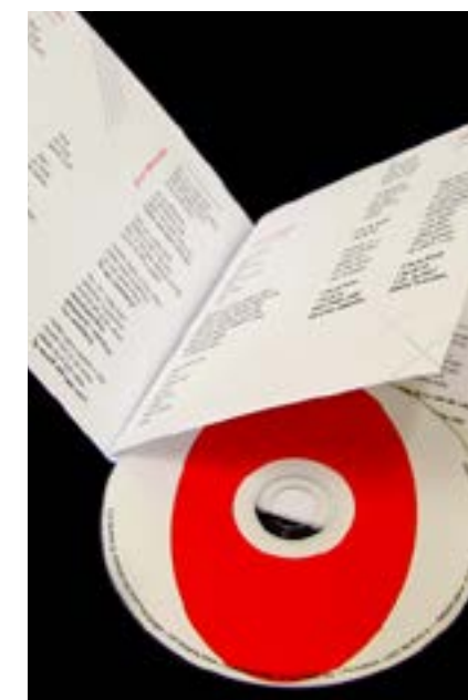
Sonyk Bel – design hudebního alba Pavel Kozubík