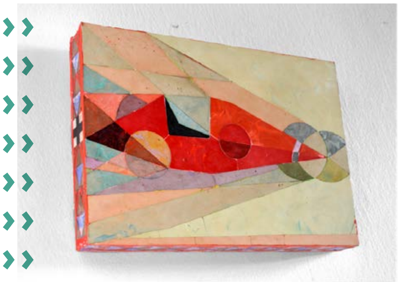
Bugatti, A4, scagliola, 2020 – Josef Mladějovský